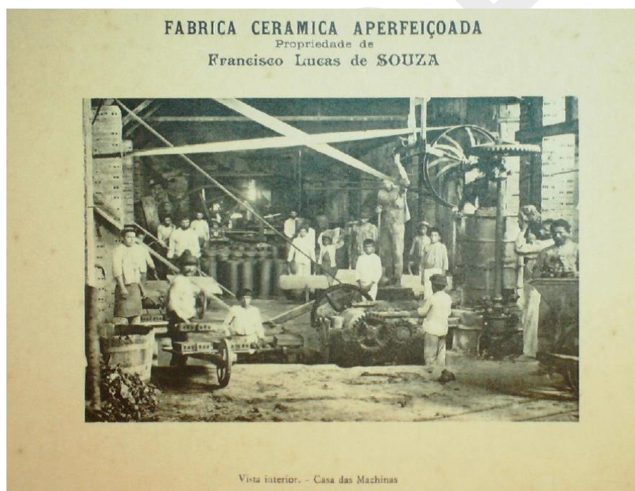
Fábrica Cerâmica Aperfeiçoada. Vista interior – Casa de Máquinas. Álbum O Indicador ilustrado do Estado do Pará . Rio de Janeiro: Courier e Belliter editores, 1910, p. 166.