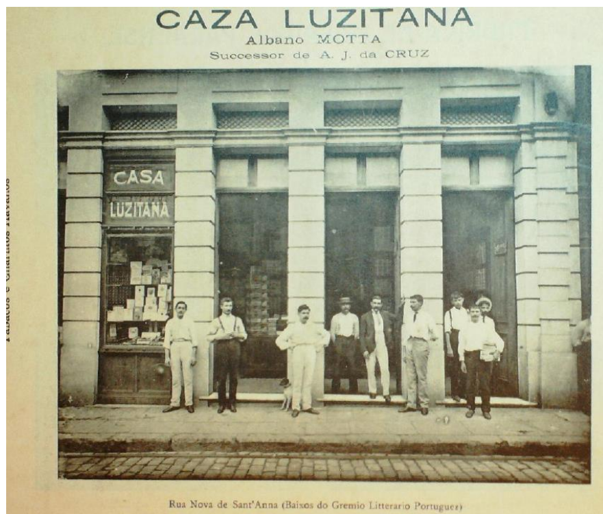
Casa Lusitana – Rua nova de Santana, baixos do Grêmio Literário e Português. Álbum O Indicador ilustrado do Estado do Pará . Rio de Janeiro: Courier e Belliter editores, 1910, p. 192.

37 Observe as duas imagens abaixo e responda à questão proposta sobre o mundo do mercado assalariado na cidade de Belém em 1910.