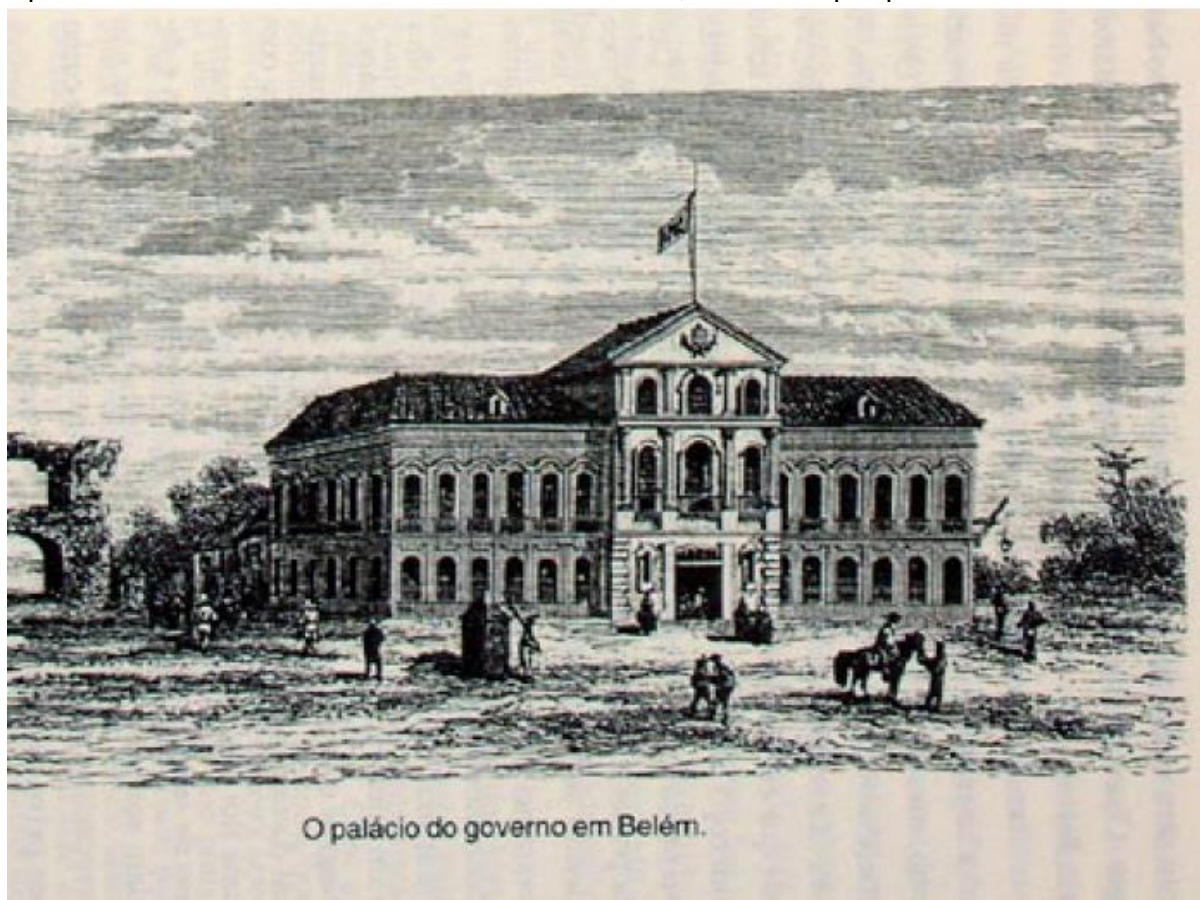
Paul Marcoy. Viagem pelo Amazonas . Manaus: EDUA, 2000, p. 291

35 Observe a imagem abaixo do Palácio do governo de Belém do Pará. Ela foi feita em 1847 durante a viagem de um francês, Paul Marcoy, pela Amazônia. Por ela podemos observar ruínas ao lado esquerdo do palácio e uma cidade ainda bem desestruturada. Por seus conhecimentos deste momento histórico da primeira metade do século XIX na Amazônia, o palácio e a cidade de Belém refletiam o estado político e social do Pará nos anos de 1830 a 1840, sobretudo porque neste momento ocorreram