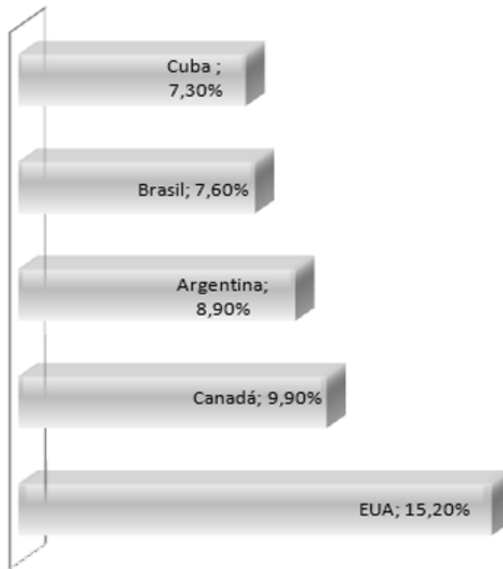
Dispêndio com saúde em proporção ao PIB

Com base no gráfico, é possível afirmar que o dispêndio do