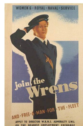
“Junte-se aos Wrens (Women's Royal Naval Service ou Marinha Naval Britânica) e libere um homem para a frota”. 1940. Royal Navy, Women's Royal Naval Service. In Imperial War Museums. site: www.iwm.org.uk . Acessado em 06 03 2016.

O primeiro país a reconhecer a necessidade do emprego da mão de obra feminina durante a Segunda Guerra Mundial foi a Inglaterra. Antes da guerra, a maior parte das mulheres inglesas só trabalhava em seus lares. No entanto, a guerra mobilizou 5,5 milhões de homens e a força de trabalho feminina passou a ser decisiva. No começo, recorreu-se ao voluntariado, preferencialmente de mulheres solteiras, para não comprometer a harmonia do lar. No entanto, o voluntariado não foi suficiente e, em 1941, o governo britânico promoveu o recrutamento de mulheres, que eram chamadas para