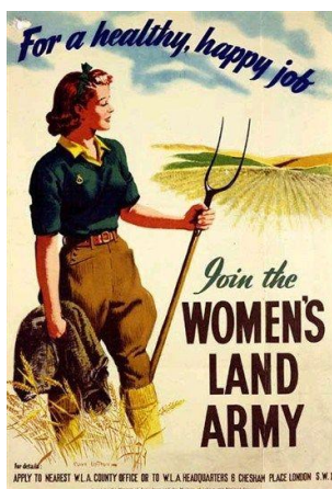
“Para um saudável e feliz trabalho: junte terras aos braços das mulheres”. 1940. Ministry of Labour on National Service In. Museum of English Rural Life. site: www.archiveshub.org . Acessado em 06 03 2016.

52. Observe as três imagens a seguir sobre o papel das mulheres inglesas na Segunda Guerra Mundial e responda à questão proposta.