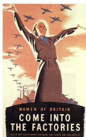
E “Mulheres da Inglaterra: venham para dentro das fábricas”. 1941. Ministry of Information. In Imperial War Museums. site: www.iwm.org.uk . Acessado em 06 03 2016.